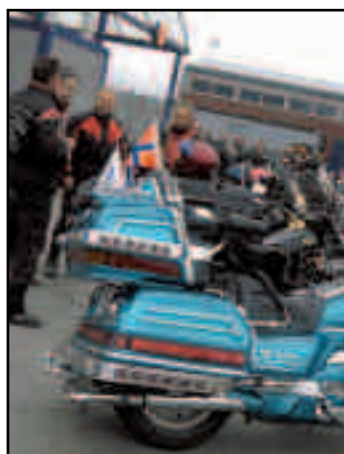
Gausdøler og andre døler gjør seg klare til Mjøsa Rundt på Strandtorget i går morges.