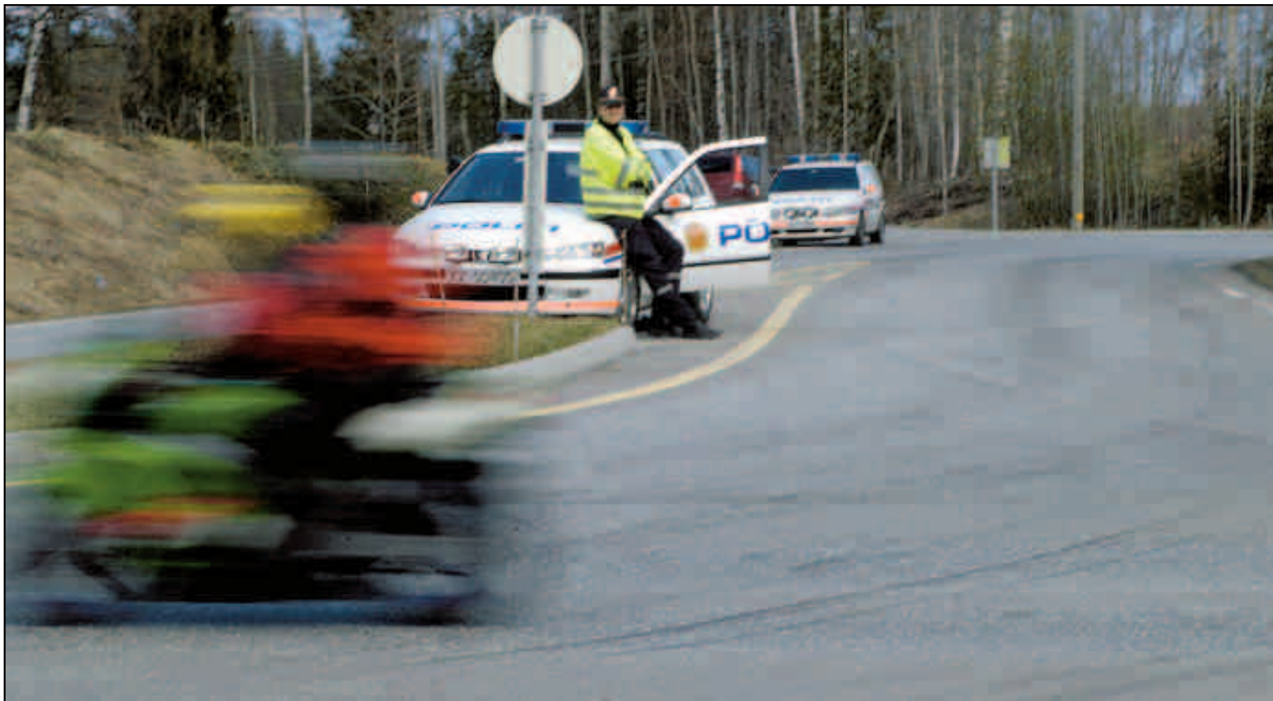
En av deltakerne som en skygge forbi en politipost under Mjøsa Rundt i går.

Mannen har vedtatt dommen fra Nord-Gudbrandsdal tingrett.