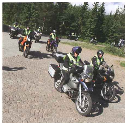
Medlemmer i Lillehammer Motorsykelklubb eskorterte bussene med deltakere på turen fra hotellet til Vegmuseet

skal forstå at motorsykkelen hører hjemme, også i et samfunn som styrer sin samferdselspolitikk etter nullvisjonen. Det var derfor ekstra gledelig at samferdselsministeren var så krystallklar da hun avviste tidligere spekulasjoner fra visse forskere om at