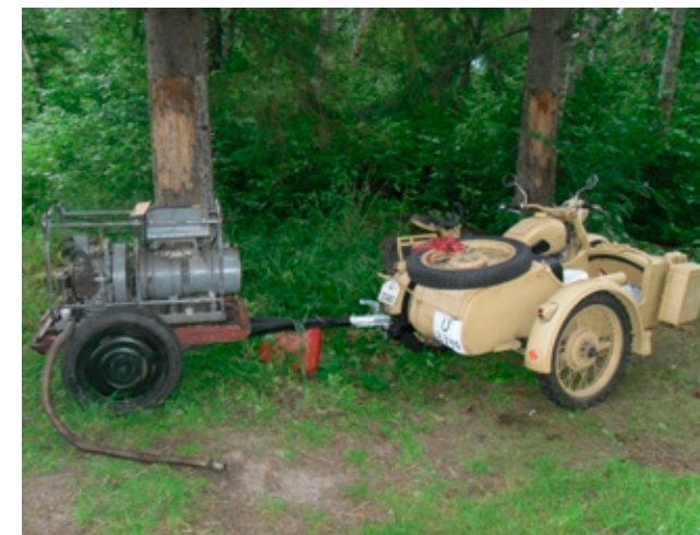
Steinkjer 2010. Rindølingen har utstyret i orden. Vi venter spent på hva som kommer til Lillehammer.

fram til en flott fjelltur som skal passe like godt for en RS/LT som en GS.