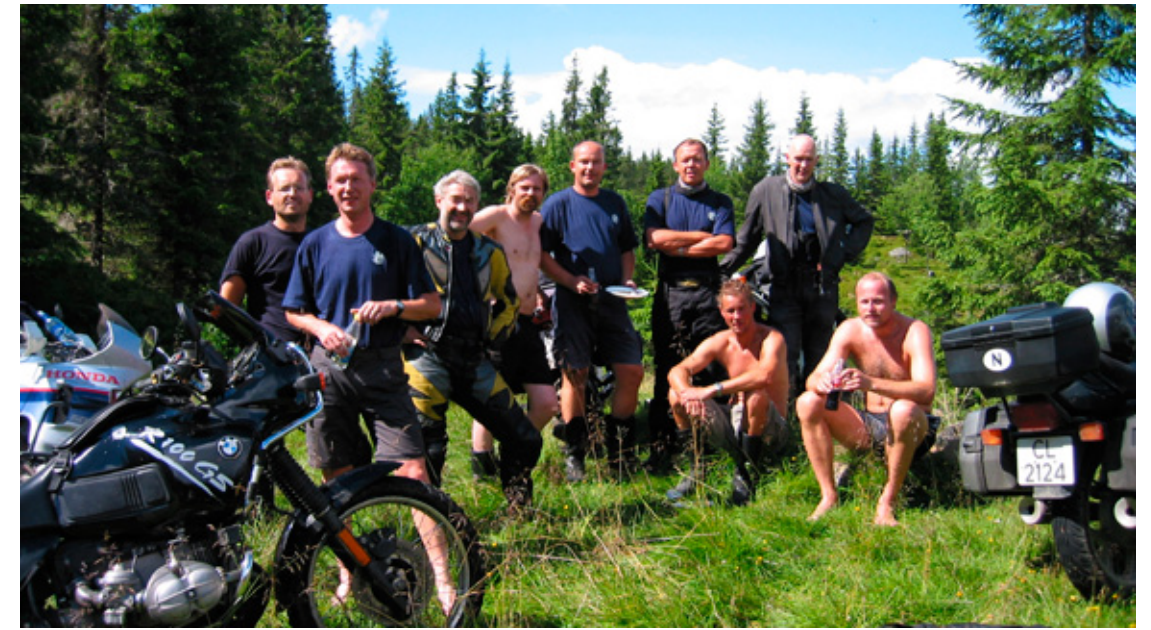
Hunderfossen 2003, mange kjente GS førere besøker vaffelpressa.

Som mange husker, hadde vi en del arrangementer som samlet folket på Hunderfossen. Dette vil vi ikke bare gjenta, men lage flere av. Det blir fellesturer på grus og asfalt, og det vil bli konkurranser. Det kan være mange som, i løpet av ei helg på Lillehammer, ønsker seg både MC- og