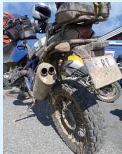
Under til venstre: Lengst kjørte norsk: Johan Olav Johansen 1494 km.

Etter årsmøtet var det også anledning til å delta på tre ulike turer: Asfalt, grus og offroad. Turene begynte med en felles parade med ca 200 sykler gjennom sentrum før oppsamling og start fra byen.