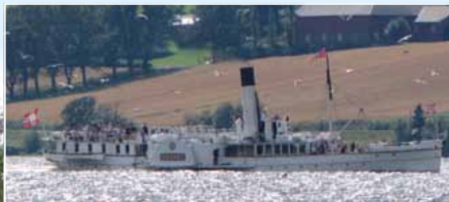
Mjøsas hvite svane «Skibladner» passerte flere ganger mens vi var på BMW-treffet.

Årets BMW-treff var lagt til Lillehammer, etter at Lillehammer Motorsykkelklubb tok på seg oppdraget i fjor høst. Sist gang treffet var i nærheten, var i 2003 – på Hunderfossen, også i regi av Lillehammer Motorsykkelklubb. De hadde tydeligvis ikke fått skrekken. Årets treff var veldig godt organisert med bl.a. prøvekjøring, turer, skyttelbuss til og fra sentrum og kafé på campingplassen.