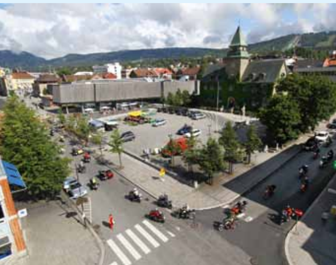
Turgruppene defilerer sammen gjennom Lillehammer før turen til de repektive gruppene startet.

til enda større stabilitet i svingene på en sykkel som i flere år er kjent som «Alpe-kongen». BMW tilbyr nå også bedre sete til sykkelen, de finnes i fire ulike høyder og utforminger (sport og komfort). Komfortsetene er veldig fint utformet, men det som satt på sykkelen jeg prøvde var for lavt – jeg satt i en grop som førte til at jeg ikke kunne flytte meg noe frem eller tilbake. (Da foretrekker jeg mitt Corbin-sete som er nesten flatt). Jeg