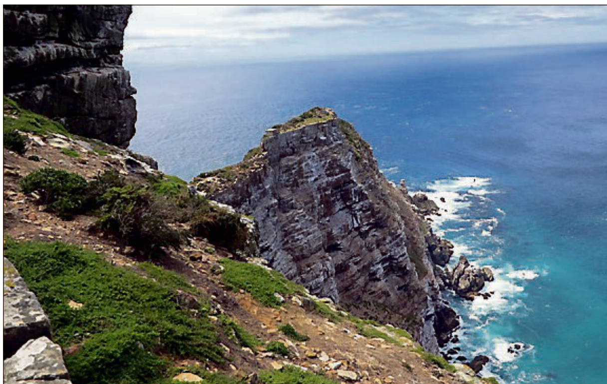
LANDSKAP: Gjengen på tur stortrivdes i afrikansk landskap, lys og farger.