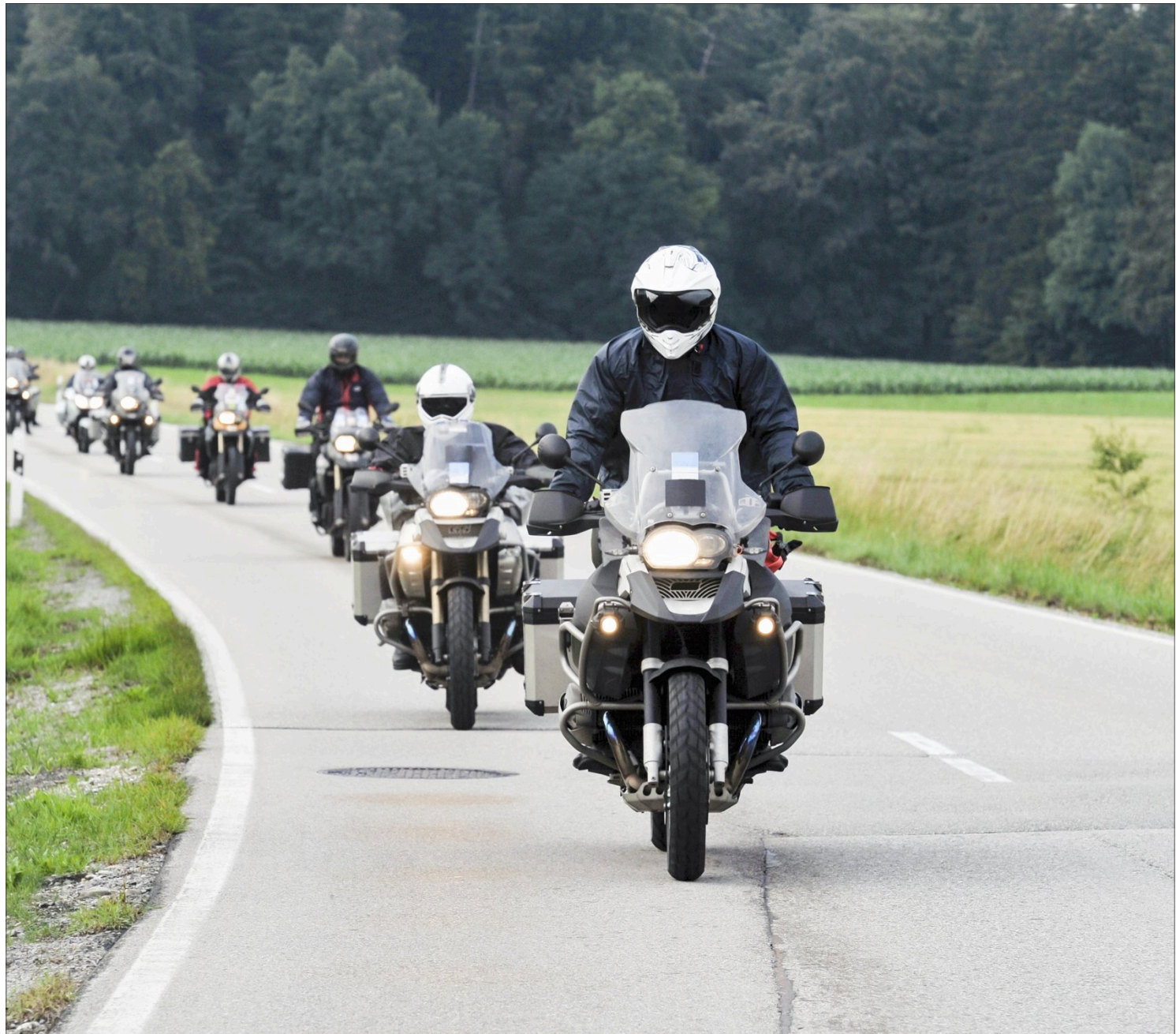
Motorsyklister fra hele Europa vil komme til FIM-Rally i Lillehammer neste år.

Målet med treffet er å stimulere til internasjonalt samkvem